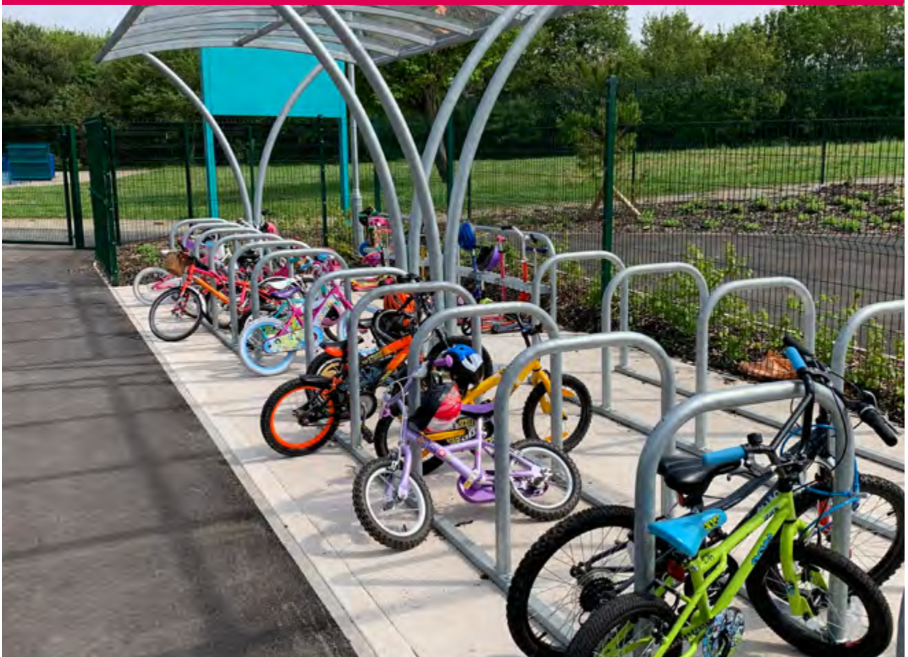
Ysgol Gynradd Gymraeg Hamadryad

Mae capasiti a nifer derbyn ysgol wedi eu seilio ar sut y caiff ystafelloedd dosbarth a gofodau eraill yn yr ysgol eu defnyddio ar gyfer addysgu a dysgu.