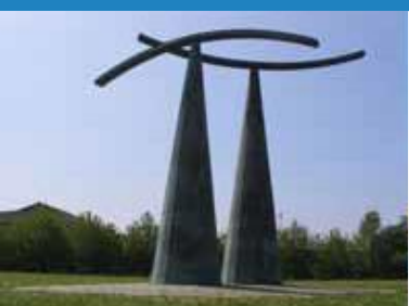
1992 Gorsaf Gudd