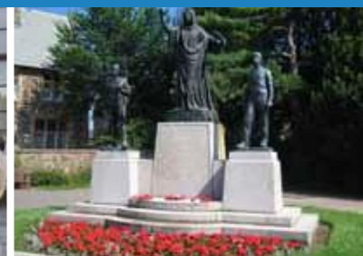
1924 Cofeb Rhyfel Llandaf