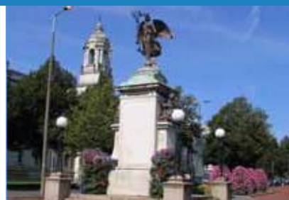
1909 Cofeb Rhyfel De Affrica