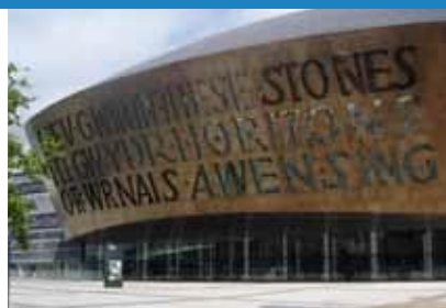
2005 Canolfan Mileniwm Cymru