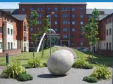
2000 Yr Wy Mawr