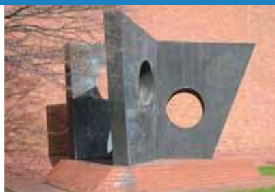
1968 Tri Lletraws (Cerdded Mewn)