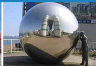
1995 Golygfa Breifaf