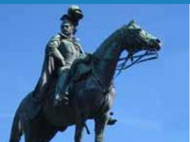
1909 Is-Iarll Cyntaf Tredegar