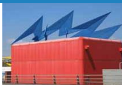
1994 Fflach Las, Bocs Pŵer a Darnau Rhwyl