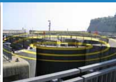
2007 3 Hirgylch ar gyfer 3 Loc