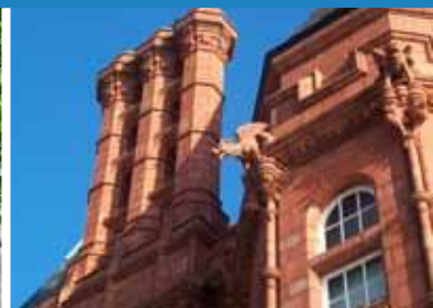
1896 Adeilad y Pierhead