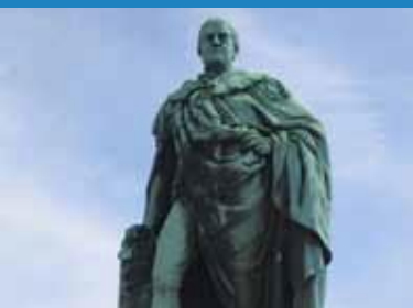
1853 Cerflun o Ail Ardalydd Bute