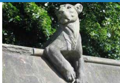
1888 Wal yr Anfeiliaid