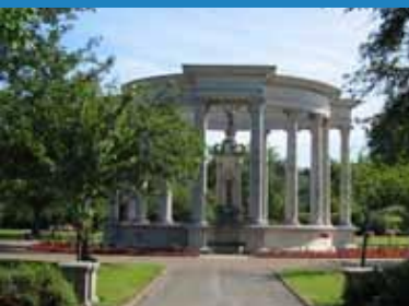
1928 Cofeb Rhyfel Genedlaethol Cymru