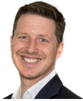
Y Cynghorydd Caro Wild Newid yn yr Hinsawdd